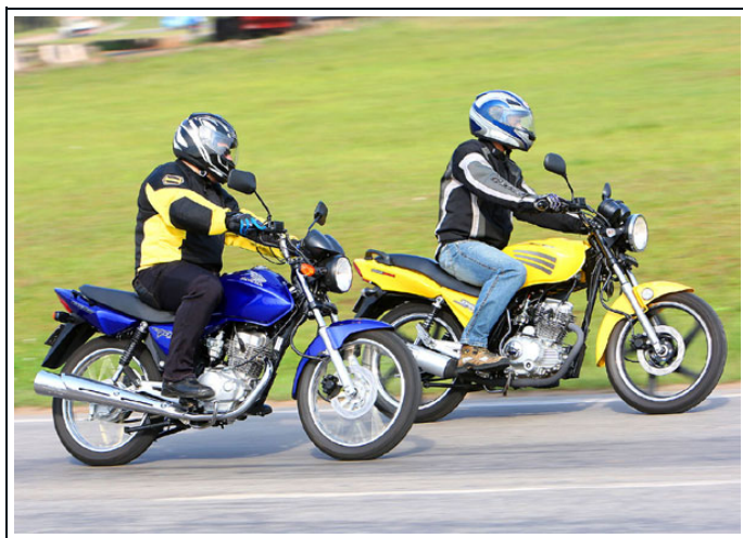
Honda CG 150 Titan ESD e Dafra Speed 150

A "velha" Honda CG 150 Titan ESD enfrenta a "novata" Dafra Speed 150. Confira o comparativo entre os modelos, que juntos já venderam 376.406 unidades nos nove meses do ano. Texto: Arthur Caldeira/Agência INFOMOTO